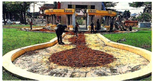
公园的喷水池已长时间失灵，目前正在进行维修工作。

他说，市议会自资展开上述工程，惟计划的“新元素”还在讨论中，因此整体花费还在估算当中。