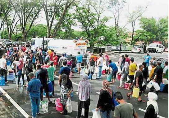
州政府致力遏止河流受污染而制水的事件，也避免民众忙“补水”的情况重演。（档案照）

（八打灵再也3日讯）雪州政府经过加强执法与监督、修改法案加重刑罚、提高保护水源的意识、“生物修复”（BioRemediation）计划及其他努力下取得成效，过去大约9个月内明显减少河流污染导致的制水事件。雪州5个县共32万3623个供水户头的用户，8月31日因士毛月河受类似溶剂（solvent）异味的污染，士毛月河滤水站关闭后面对制水，直至9月3日午夜12时才全面恢复正常供水。这回也是继去年11月雪兰莪河出现污染事故而断水的相隔大约9个月之后，今年第一宗因河流受污染而造成的制水事件。