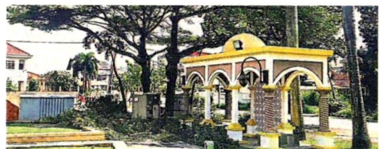
沦为流浪汉住所。公园内的凉亭，一再