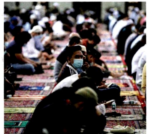
Seramai 100 orang jemaah dibenarkan untuk menunaikan solat Jumaat dan 50 jemaah bagi solat fardu lima waktu di seluruh masjid di Selangor.

Tambah beliau, pengurusan jenazah bukan Covid-19 juga dibenarkan di masjid dan surau negeri ini dengan kehadiran kaum kerabat waris seramai 20 orang dan enam orang pihak jawatankuasa masjid atau surau.