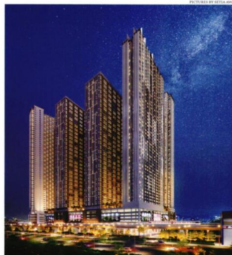
Artist's impression of Astrum Ampang, which has an estimated GDV of RM1.6 billion

Phase 1 units are targeted at first-time homebuyers aged below 40. "Nowadays, the younger generation are not able to own a property