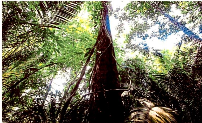
A group of Orang Asli from several settlements at the Kuala Langat North Forest Reserve, along with environmental groups, had last year protested to the degazettement plan.

Putra MIC urged the Selangor government to find an immediate solution to the Kuala Langat North Forest Reserve degazettement issue.