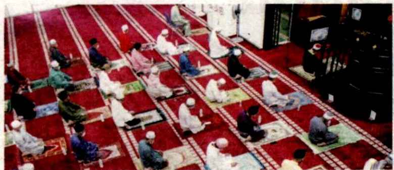
HANYA individu yang lengkap dua suntikan sahaja boleh menunaikan solat jemaah di masjid dan surau di Selangor.

Mengikut ketetapan baharu itu, seramai 100 jemaah termasuk pentadbir dibenarkan menunaikan solat Jumaat di enam